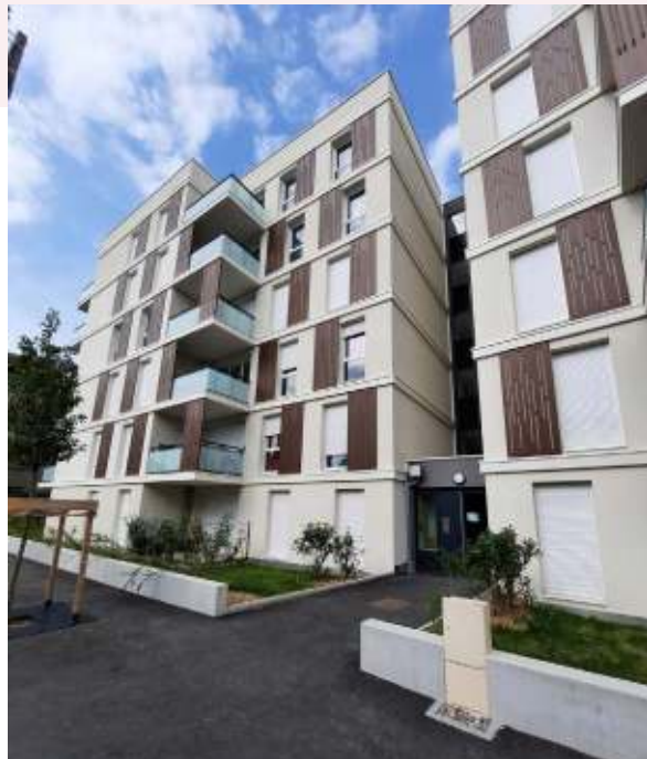
Résidence Horizon Salève à Ambilly (74) 26 logements intermédiaires et 17 logements sociaux. Livrés en 2021.