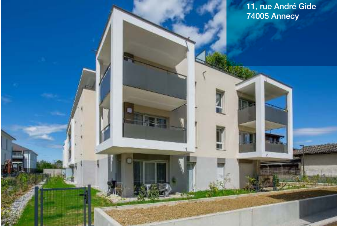
Résidence Le Dalhia à Vétraz-Monthoux (74) 15 logements sociaux livrés en 2021.