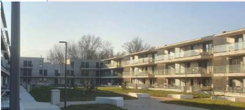
Résidence Les Suites du Lac à Thonon-les-Bains (74) 24 logements intermédiaires et 28 logements sociaux livrés en 2021.