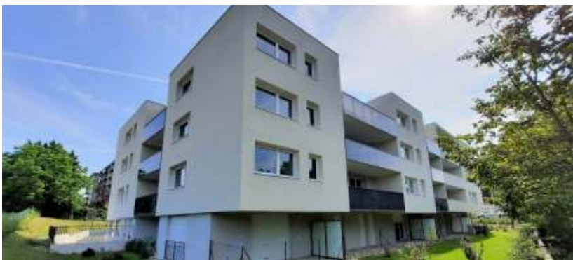
Résidence Quai d'Arve à Annemasse (74) 28 logements intermédiaires et 9 logements sociaux livrés en 2021.