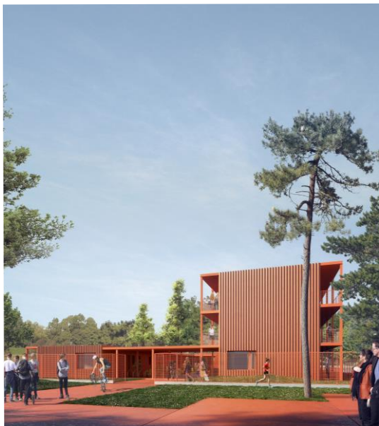
© Bauchet &amp; De la Bauvrie