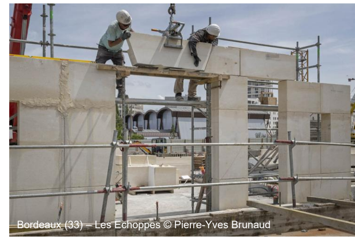
Bordeaux (33) – Les Echoppés