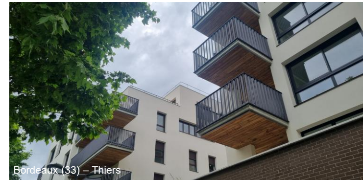
Bordeaux (33) – Thiers