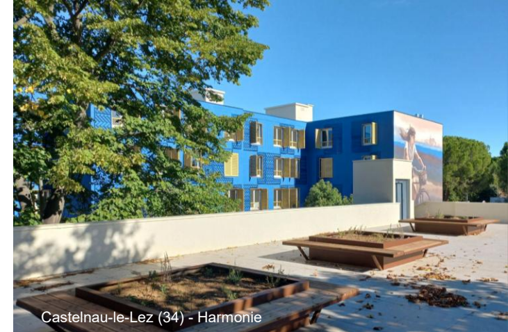
Castelnau-le-Lez (34) - Harmonie