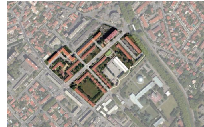
Toulouse (31) - Campmas