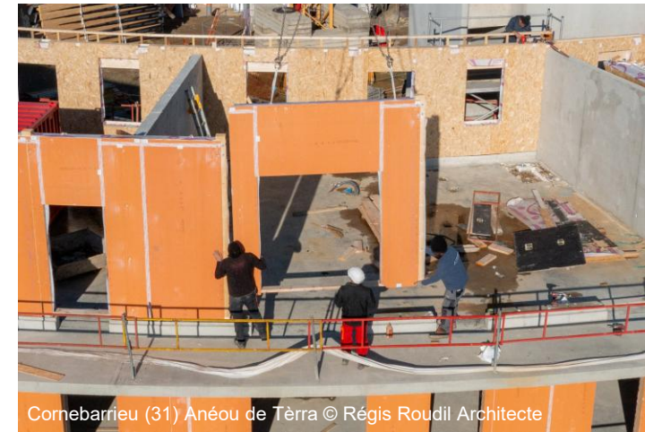
Cornebarrieu (31) Anéou de Terra © Régis Roudil Architecte