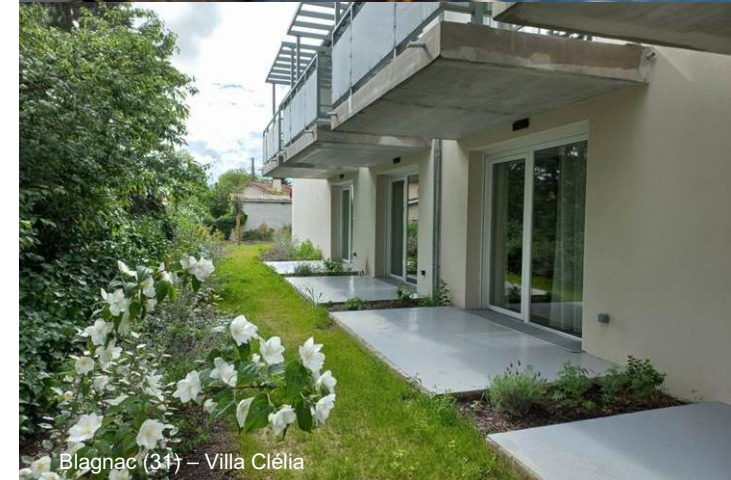
Blagnac (31) – Villa Clélia