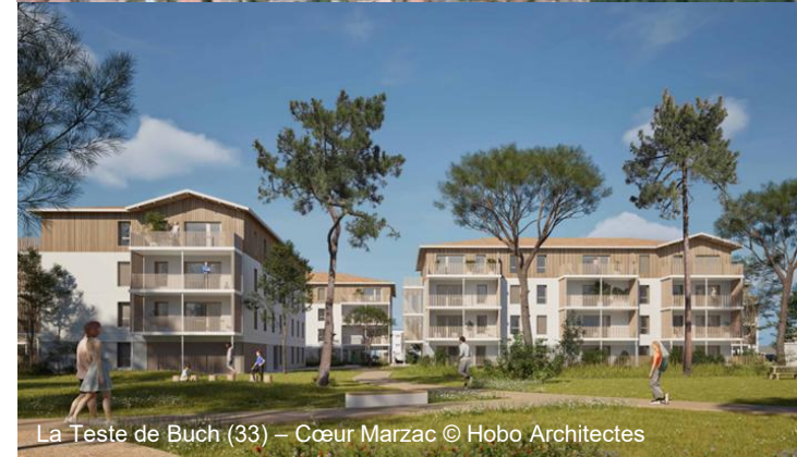
La Teste de Buch (33) – Cœur Marzac © Hobo Architectes