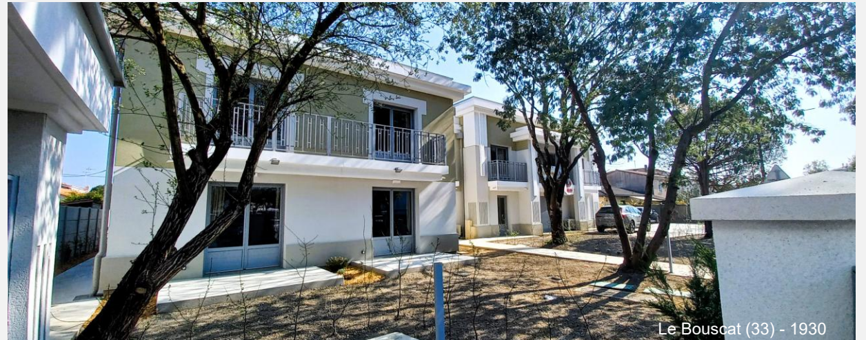
Le Bouscat (33) - 1930

En 2026, une nouvelle résidence a vu le jour au Bouscat (33) : elle est composée de 2 habitats de 735 m 2 ayant pour vocation d'accueillir respectivement 8 et 9 personnes âgées en perte d'autonomie.