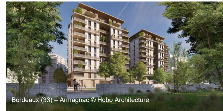
Bordeaux (33) – Armagnac © Hobo Architecture