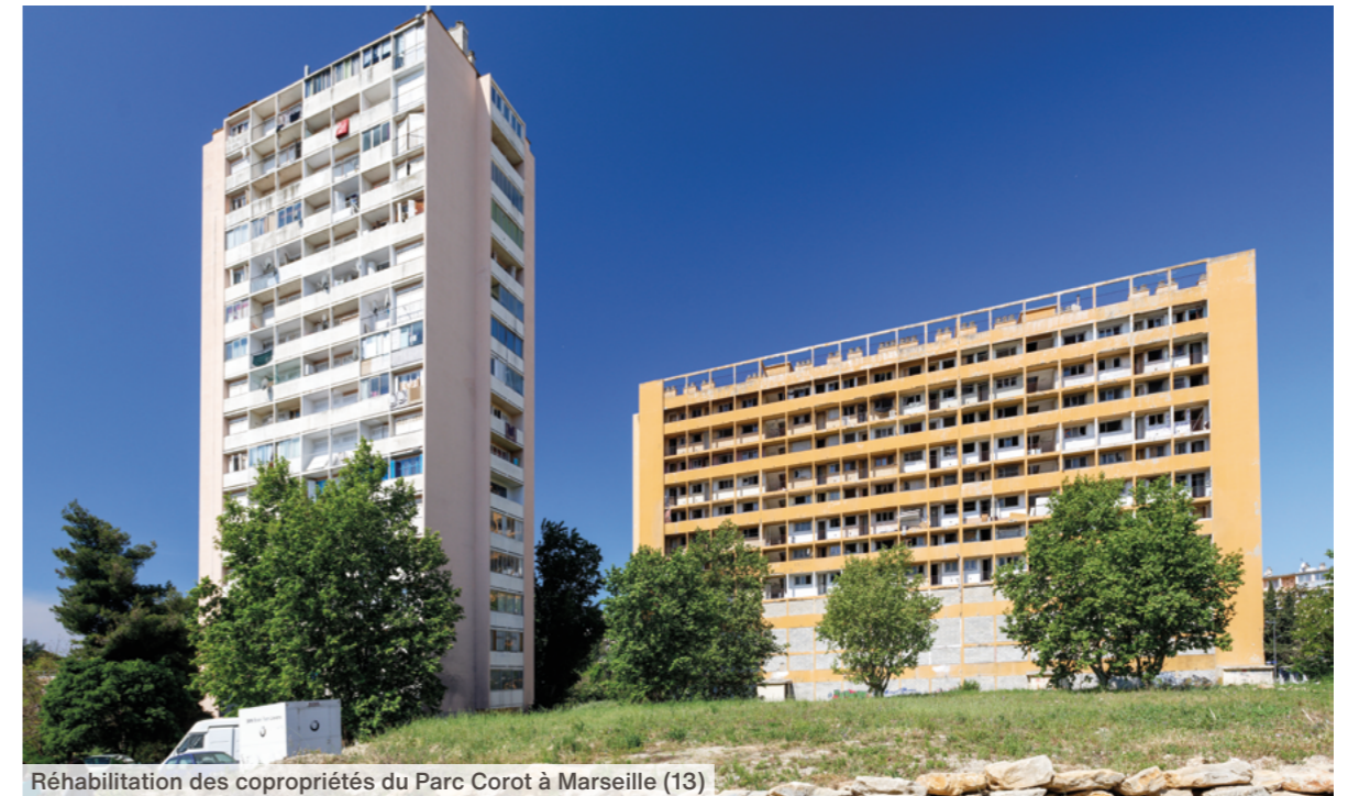
Réhabilitation des copropriétés du Parc Corot à Marseille (13)