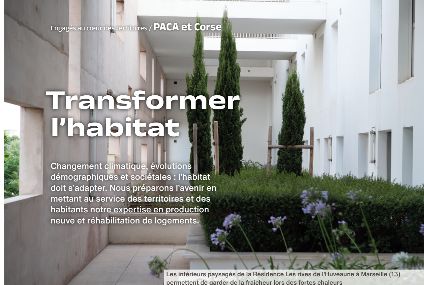
Les intérieurs paysagés de la Résidence Les rives de l'Huveaune à Marseille (13) permettent de garder de la fraîcheur lors des fortes chaleurs

Changement climatique, évolutions démographiques et sociétales : l'habitat doit s'adapter. Nous préparons l'avenir en mettant au service des territoires et des habitants notre expertise en production neuve et réhabilitation de logements.