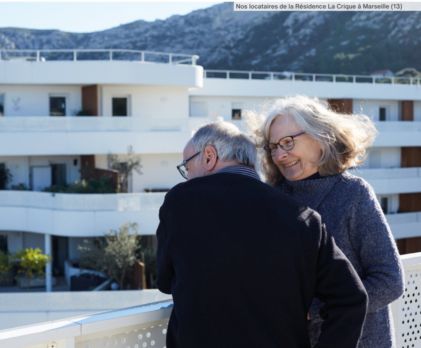
Nos locataires de la Résidence La Crique à Marseille (13)

Pour accompagner le dynamisme de la région, nous avons élaboré un projet de territoires couvrant la période 2024-2026. Celui-ci fixe nos grandes priorités et pose notre stratégie au plus près des besoins de chaque territoire, notamment les plus tendus.