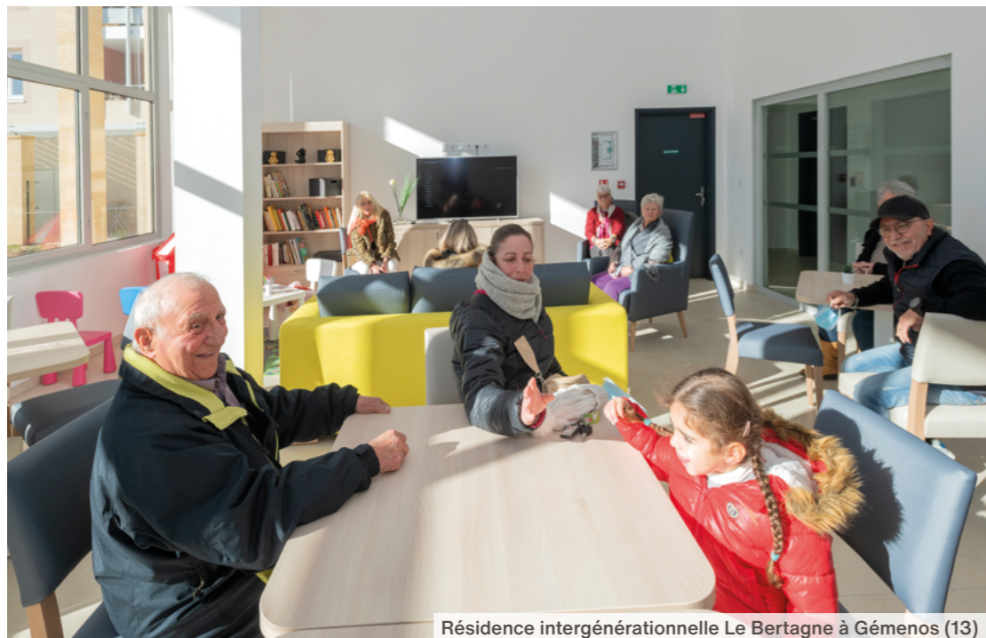
Résidence intergénérationnelle Le Bertagne à Gémenos (13)