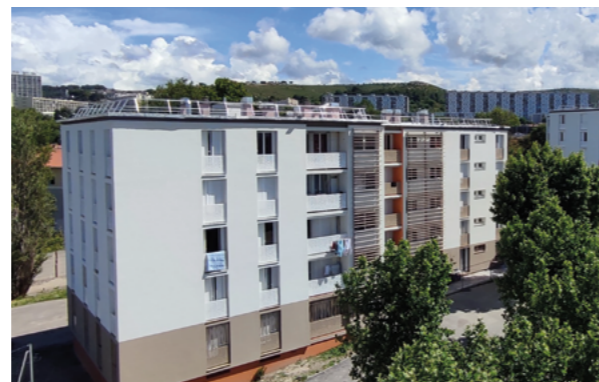
Réhabilitation de notre patrimoine ancien avec l'exemple de la Résidence Les Tilleuls à Marseille (13)