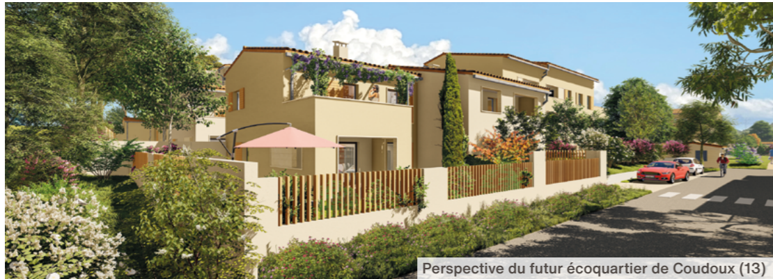
Perspective du futur écoquartier de Coudoux (13)

Le projet s'inscrit ainsi dans une démarche environnementale forte, et vise les labels :